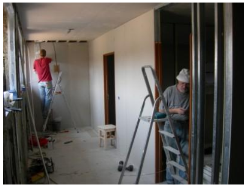
Begin zomer 2007