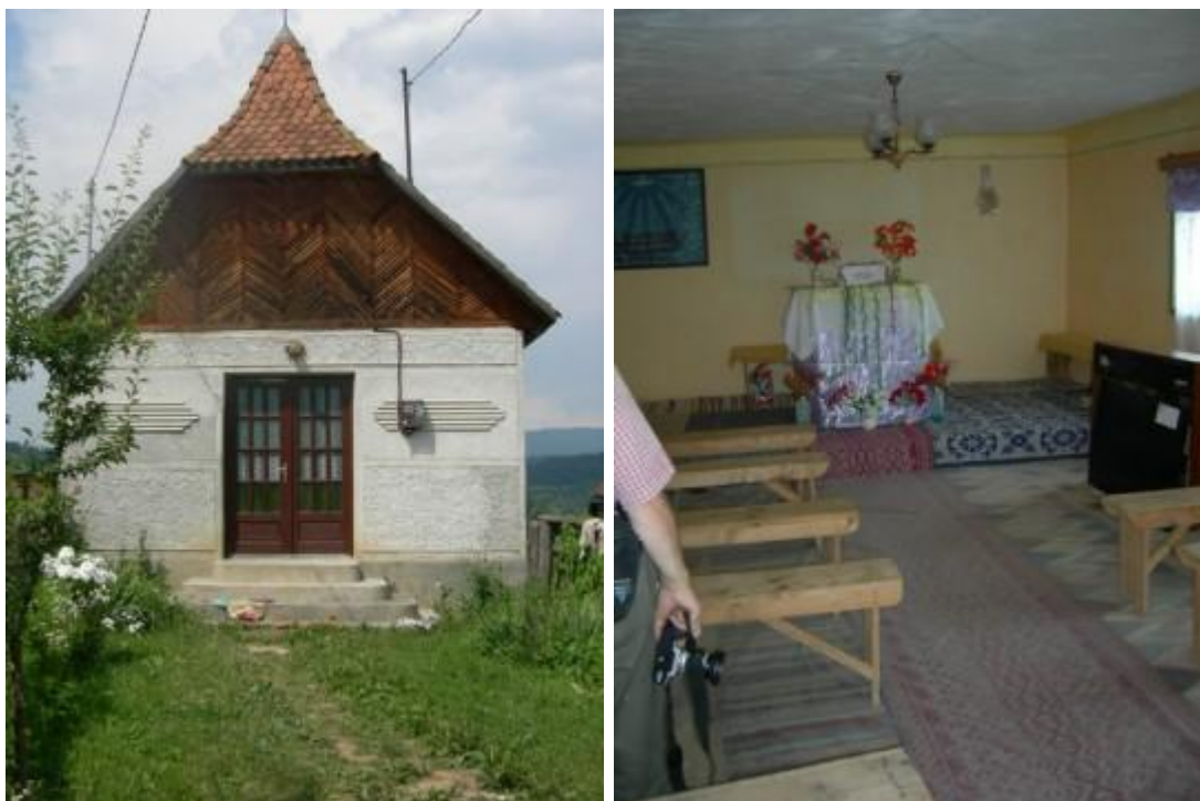
Het (pinkster) kerkje in het zigeunerdorp